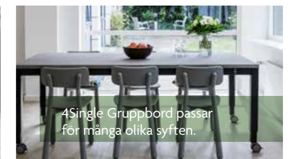
4Single Gruppbord passar för många olika syften.