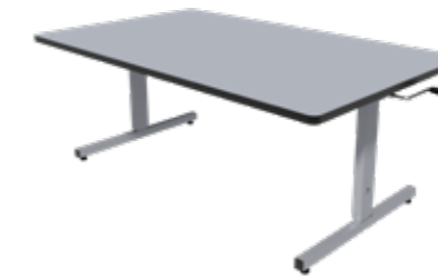
ROPOX Ergo Gruppbord