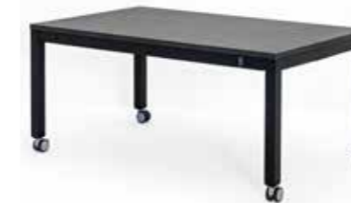
ROPOX 4Single Gruppbord