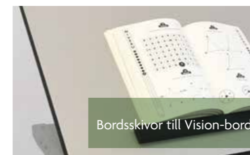
Bordsskivor till Vision-bord

Vision-bordet har inbyggda stålplattor så att MagRule kan placeras var som helst på bordet.