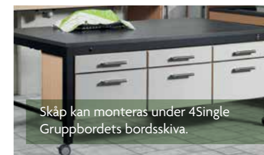
Skåp kan monteras under 4Single Gruppbordets bordsskiva.