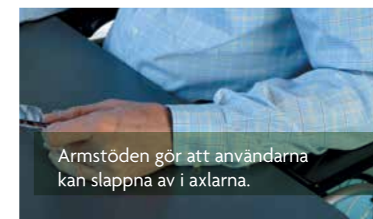
Armstöden gör att användarna kan slappna av i axlarna.