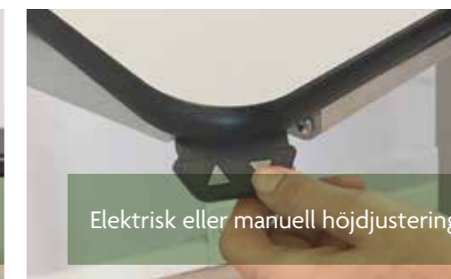
Elektrisk eller manuell höjdjustering