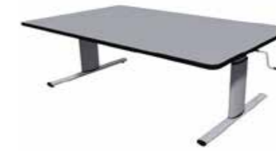
ROPOX Vision Gruppbord

Alla gruppbord är enkla att justera i höjd, de är tillverkade av kvalitetsmaterial som är lätta att rengöra och de har gott om plats för benen, vilket gör att de passar alla användare, oavsett hur rörliga de är. Så om du letar efter ett modernt och elegant gruppbord där det också går att tillgodose funktionshindrades krav är vårt sortiment av gruppbord verkligen värt att ta en titt på.